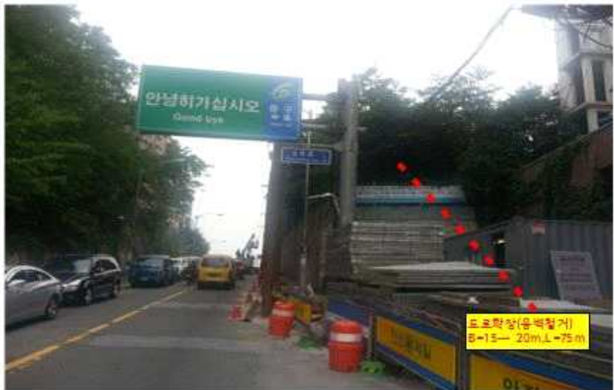
현 황 사 진(중구→성동구)