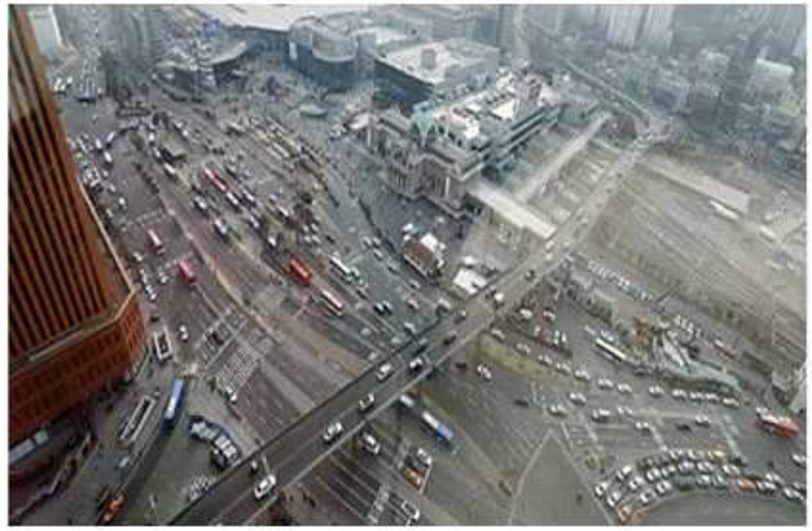
현 황 사 진(서울역 고가차도)