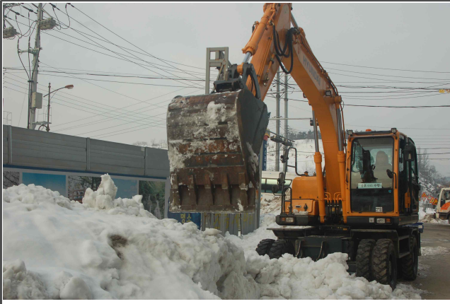
삼척시 폭설피해복구 지원