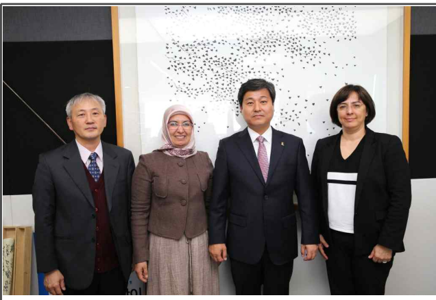
터키 방문단 보건소 벤치마킹