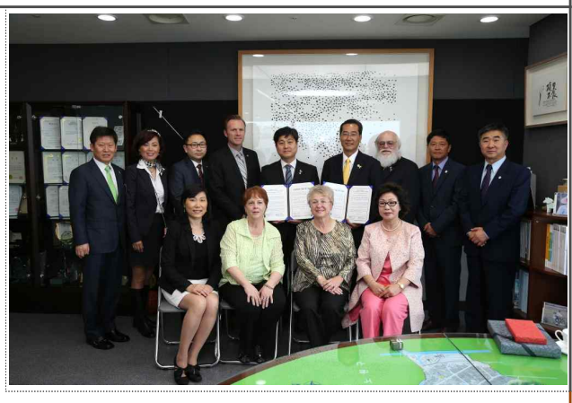
미국 부에나파크시 의향서 체결