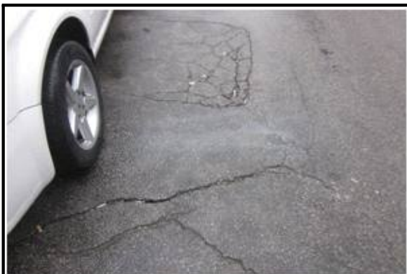
사진 7 도로 부분침하 진행 현황내용 도로 횡단균열 발생