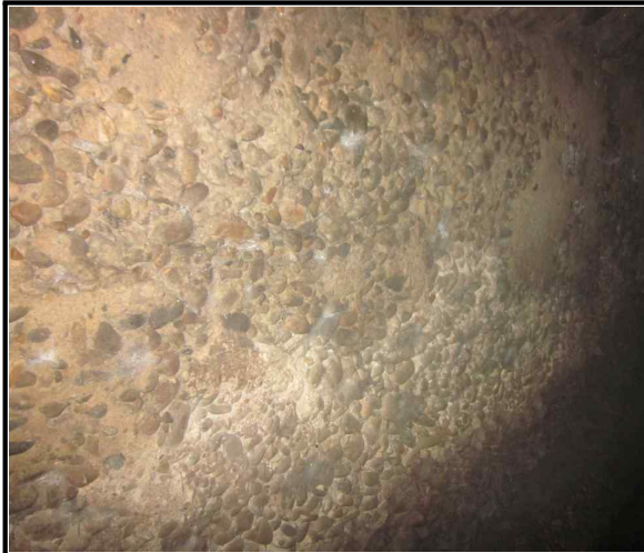
사진 3 벽체 현황내용 재료분리