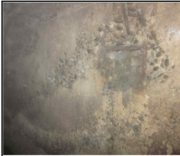
사진 1 벽체 현황내용 재료분리 및 철근노출