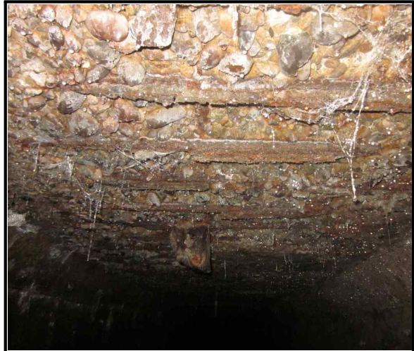
사진 4 상부슬래브 현황내용 재료분리 및 철근노출