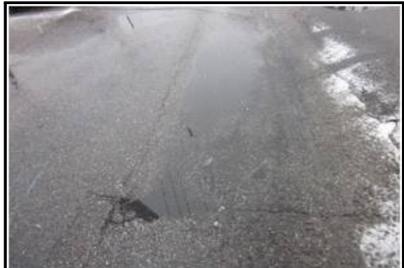
사진 8 도로 부분침하 진행 현황내용 도로 종단균열 발생