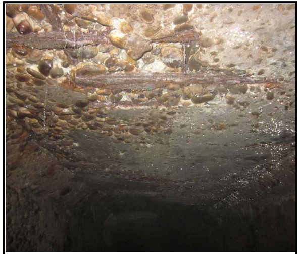
사진 2 상부슬래브 현황내용 철근노출