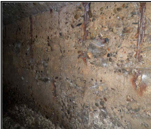
사진 5 벽체 현황내용 재료분리 및 철근노출