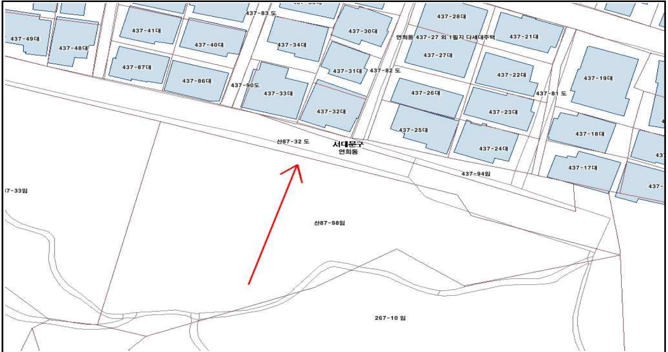
위치도 (연희동 산87-98)