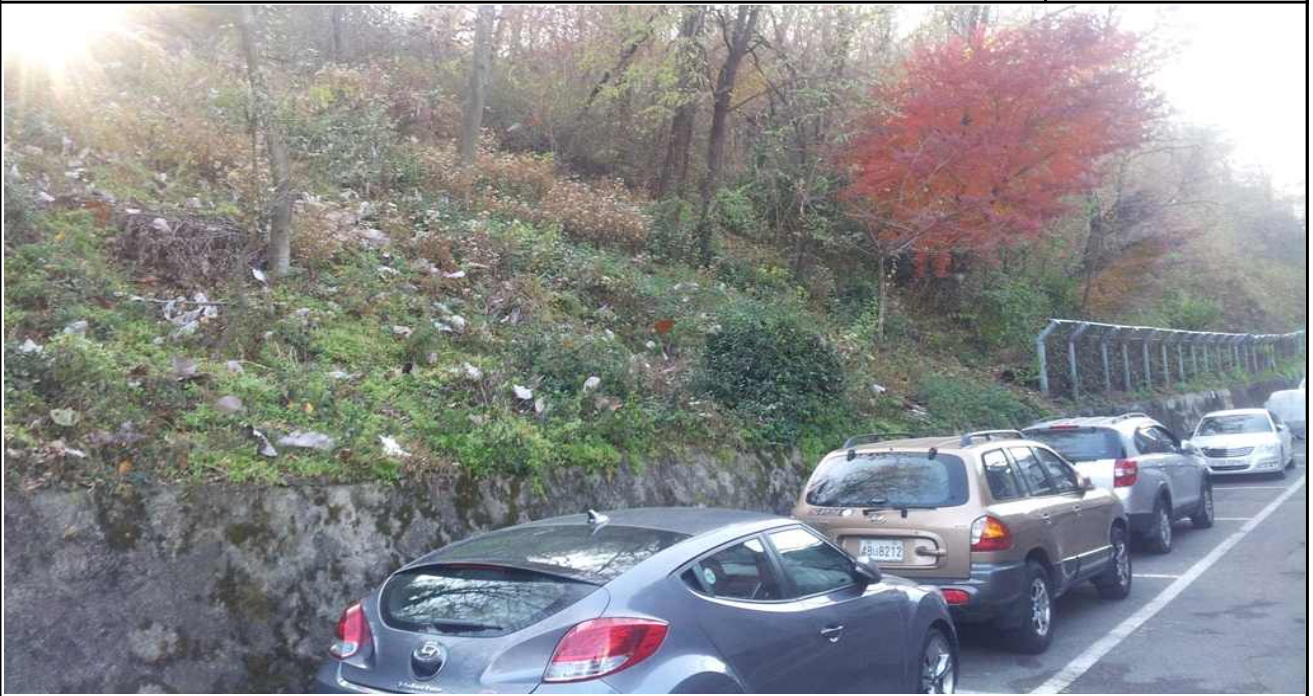
현 장 사 진 (연희동 산87-98)