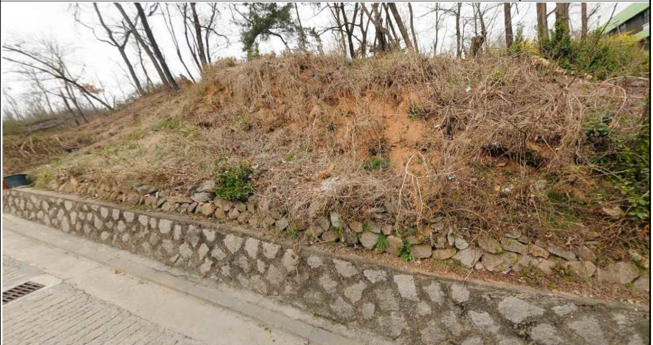
현 장 사 진 (연회동 267-10)