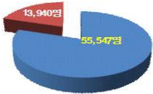
경로행사 참여율 : 25.1%