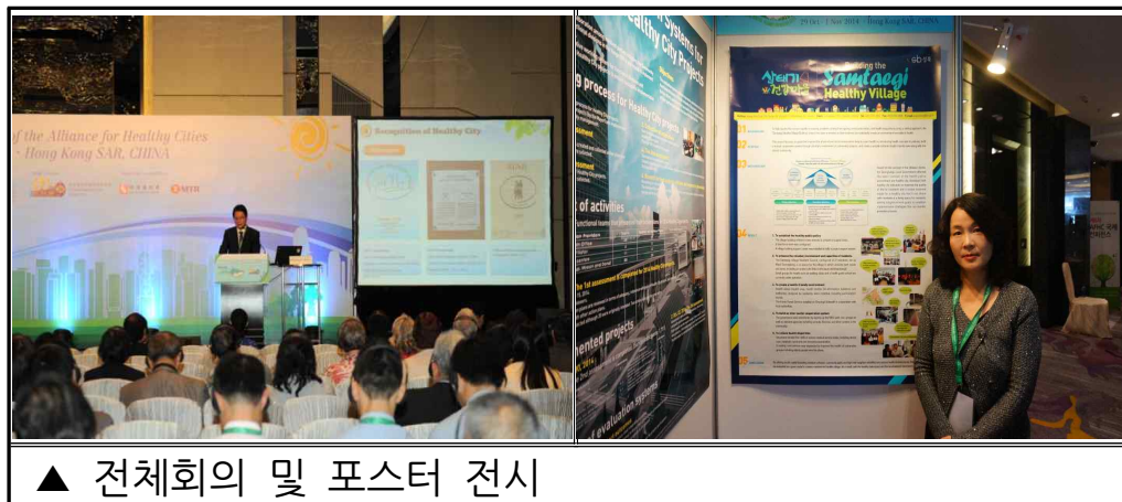
▲ 전체회의 및 포스터 전시