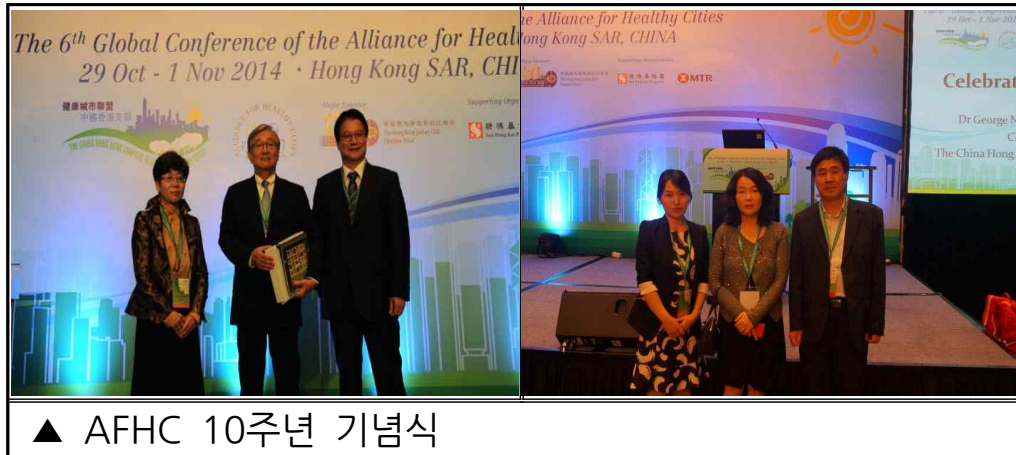
▲ AFHC 10주년 기념식