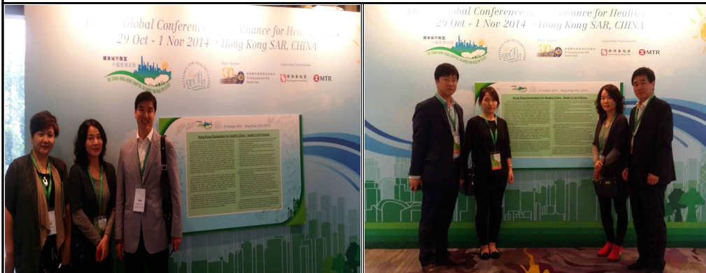
▲ 참가자 대표단