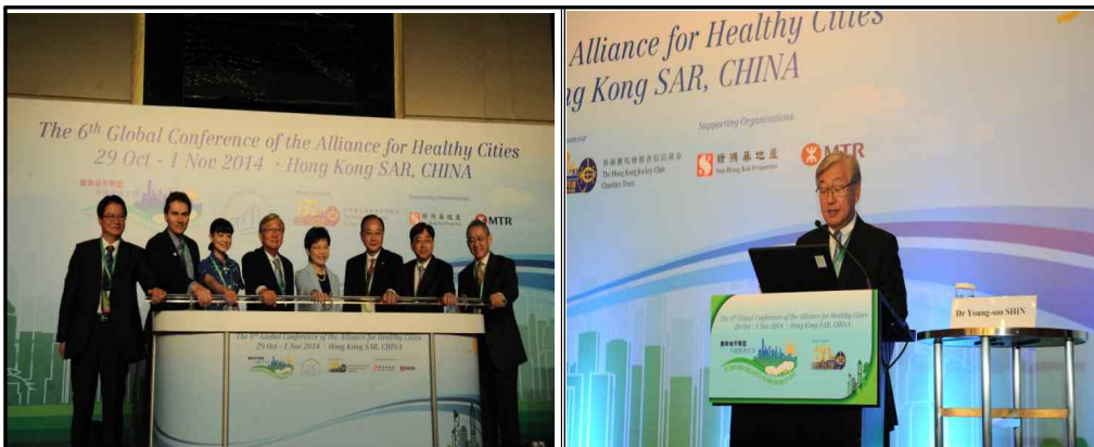
▲ 컨퍼런스 개회식 및 기조연설