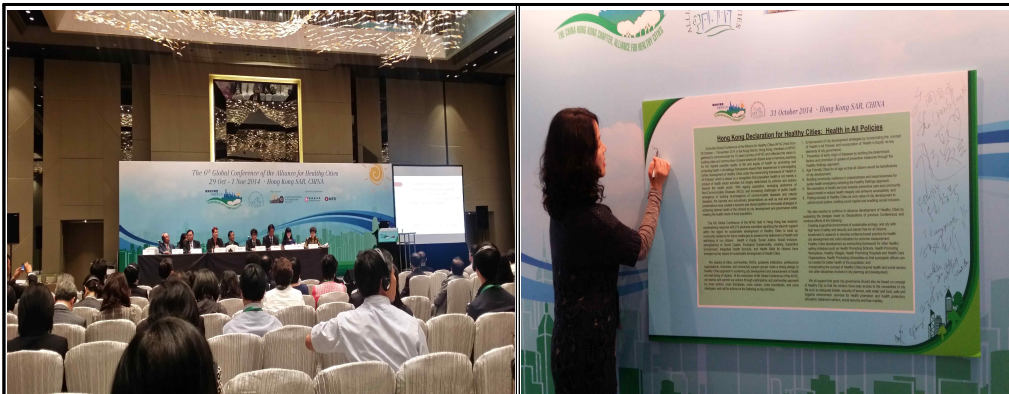
▲ AFHC 총회 및 홍콩선언문 서명