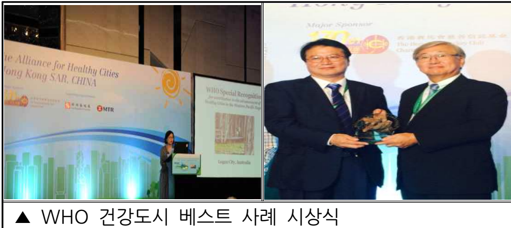
▲ WHO 건강도시 베스트 사례 시상식