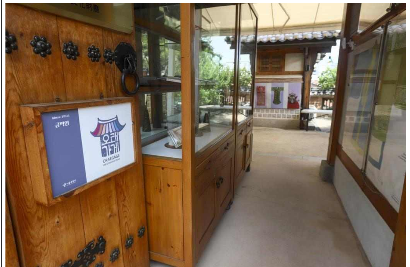
▲ 오래가게 중 가장 오래된 가게인 북촌의 '금박연'(2017년 오래가게 선정)