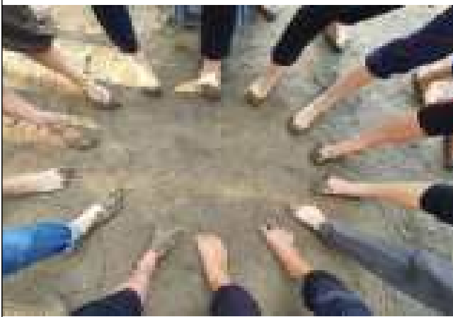
암사 <맨발걷기 힐링스쿨>