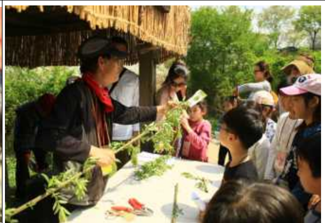
고덕 <삐삐 버들피리를 불어라>