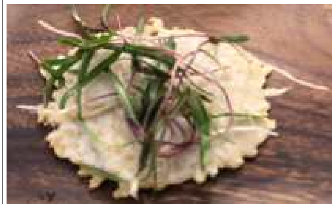
여의도샛강 <환삼덩굴 새싹샐러드-카나페>