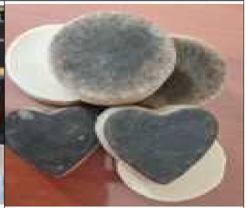
난지생태습지원 <커피박 주방비누 만들기>