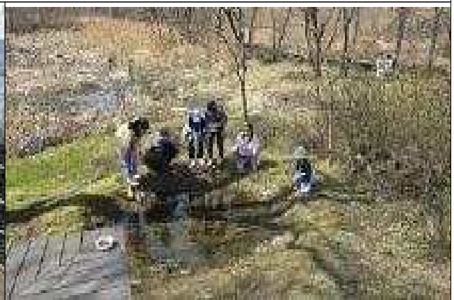
한강야생탐사센터 <봄빛 한강탐사>