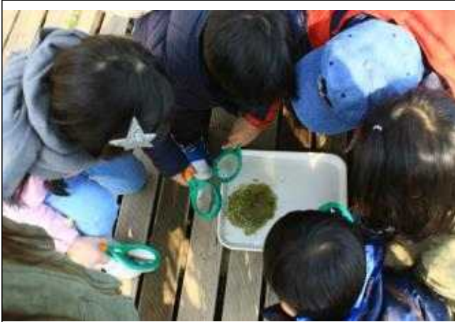
고덕 <개구리가 알을 낳았어요>