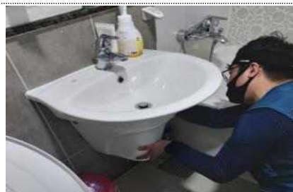
상수도 검침원 추가 누수진단