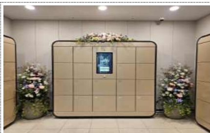
봉안함 임시보관 (하늘 정거장)