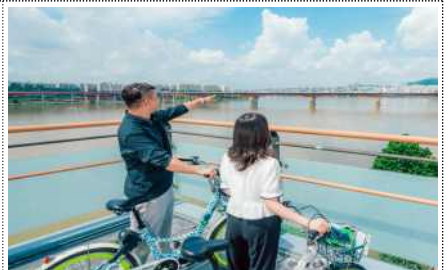
따릉이 추천코스 경관