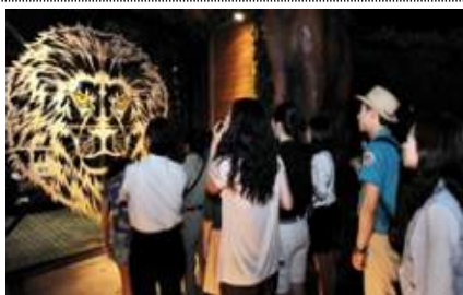
어린이대공원 야간 동물 탐험대