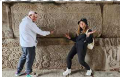
청계천 보물찾기 챌린지