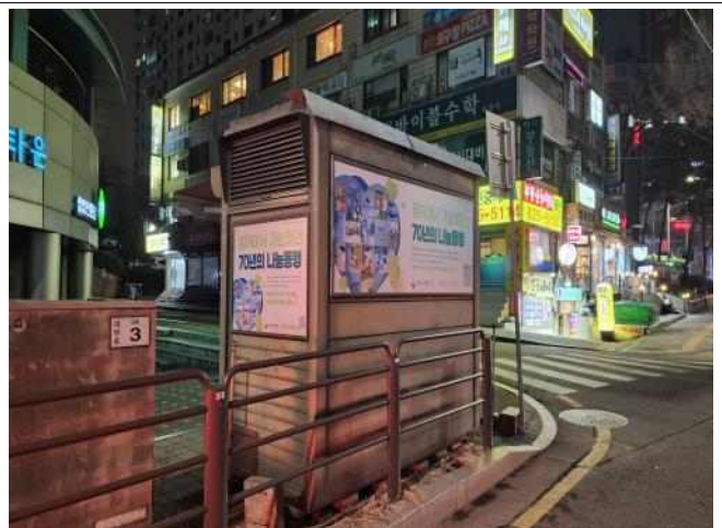
가로판매대 및 구두수선대