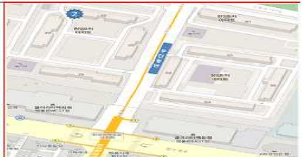
<<무단횡단 지역 >>