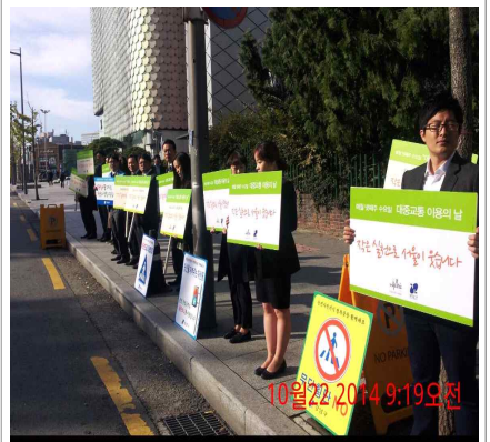
· 무단횡단 근절 캠페인+대중교통 이용 캠페인 [교통정책과, 갤러리아백화점-①,②]