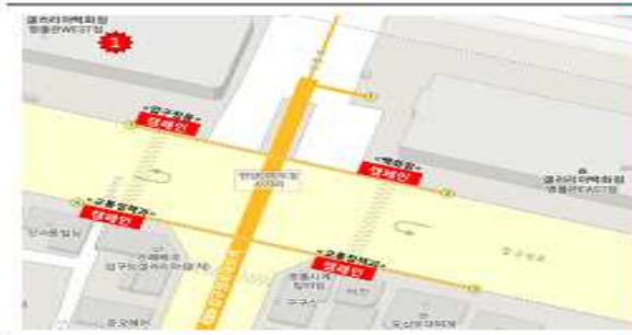
<< 합동 캠페인 >>