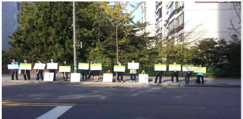
· 무단횡단 근절 캠페인 [교통정책과-②]