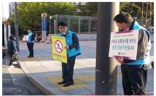
· 무단횡단근절 캠페인 [교통정책과, 압구정동-①]