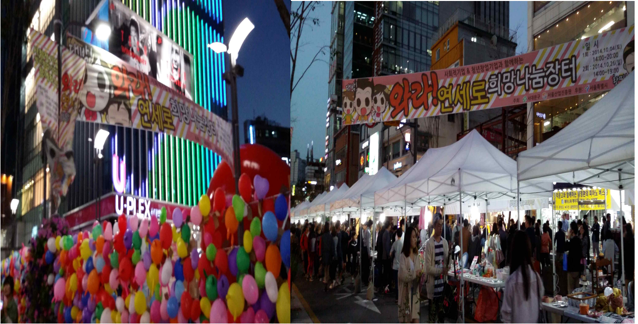
(소망풍선 만들기 체험-시민참여마당(대학생문화기획동아리 유니브) 및 부스전경)