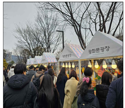
< 세종로공원 푸드존 >