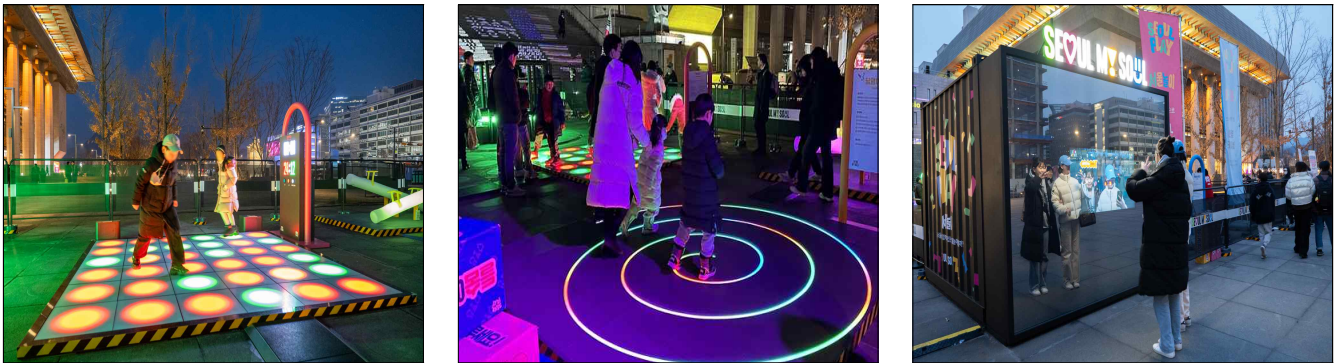
< ‘광화문 빛의 놀이터’ >