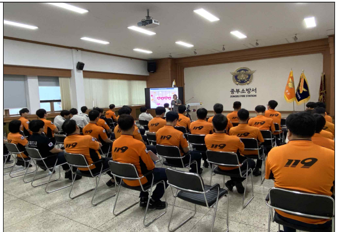
중부소방서 대상 - 재난 심리지원 특강