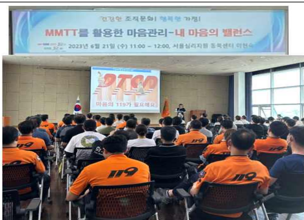
노원소방서 대상 - 재난 심리지원 특강

: 'MMPT를 활용한 마음관리-내 마음의 밸런스- 트라우마로 인한 스트레스 반응관리 및 자살 예방 교육