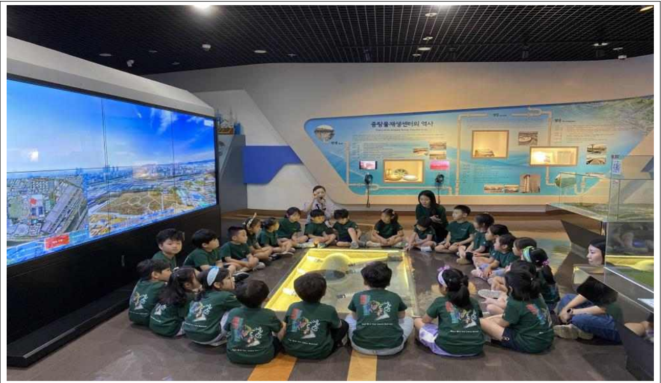
〈내 똥은 어디로 갈까?〉 교육 중 전시실 수업 사진