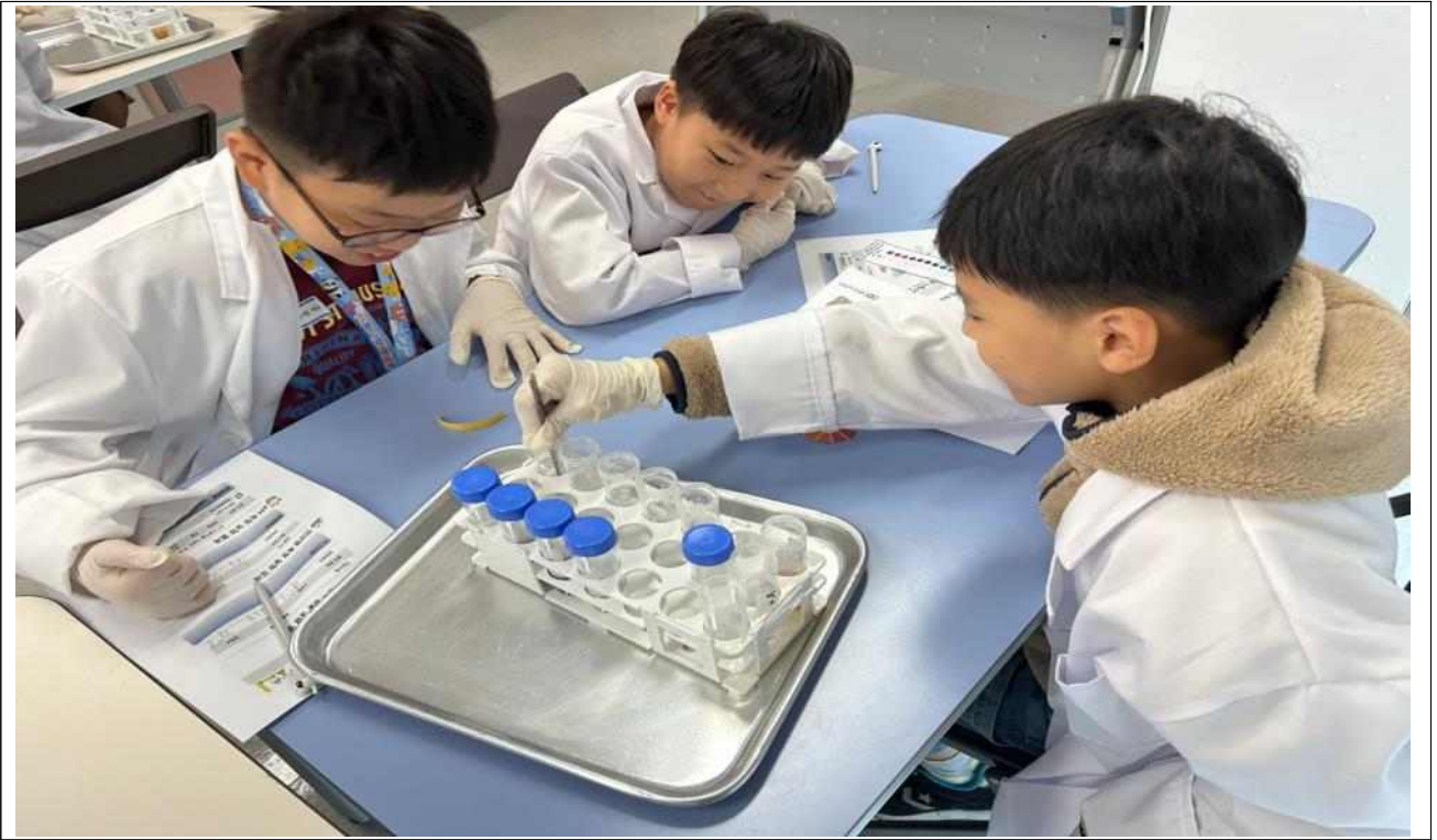
주말 교육프로그램 <방류수질이 궁금해!> 수업 사진