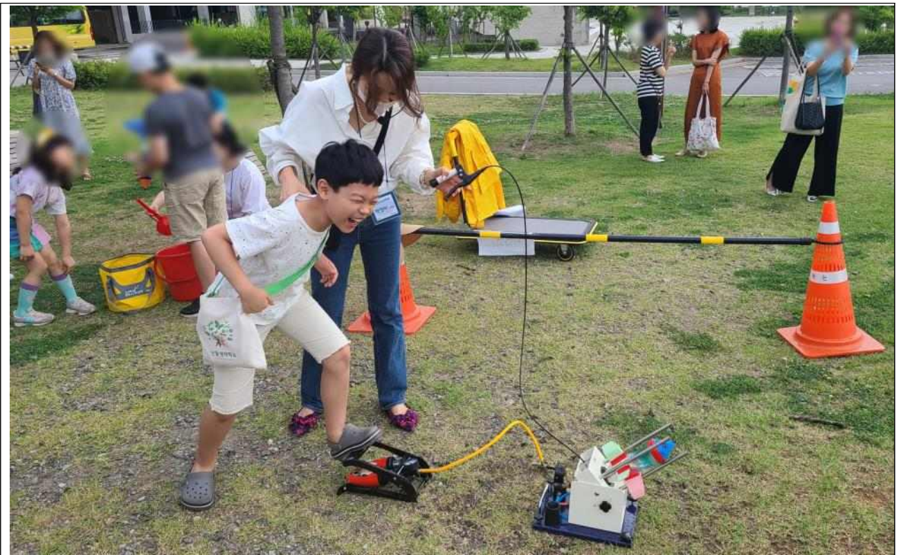
〈하수와 재이용수: 날아라 물로켓 자동차〉 수업 사진 ※ 4월 ~ 9월 교육 예정