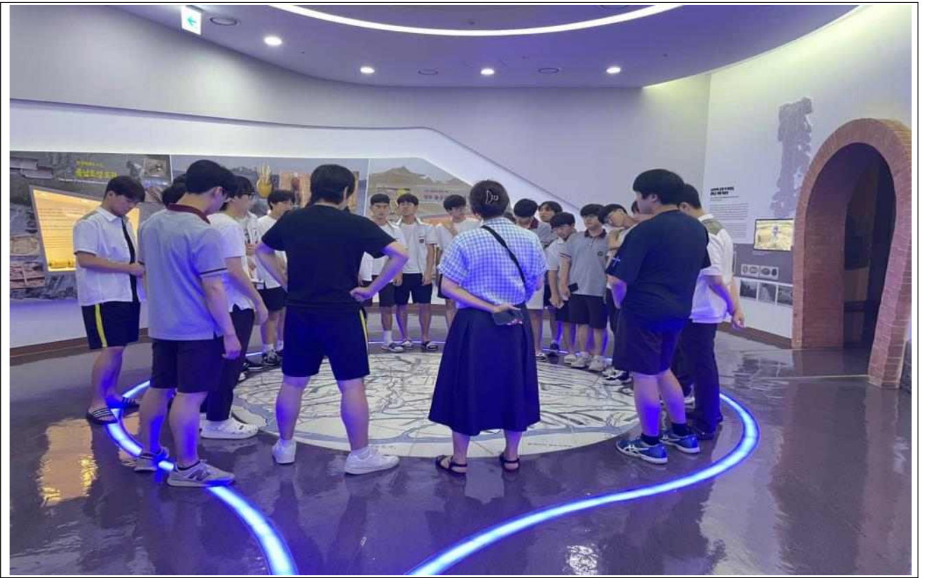
〈전시해설 프로그램〉 운영 사진