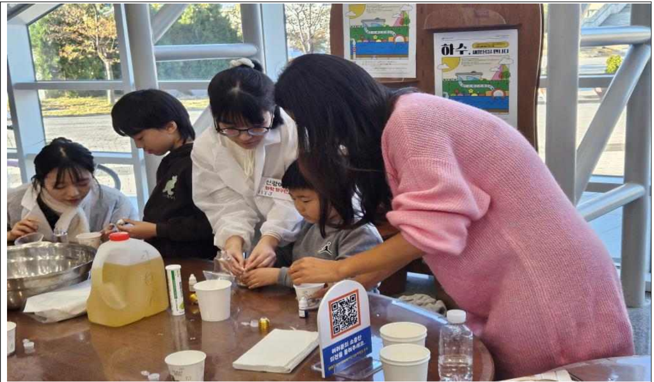
<함께해요! 열린 과학놀이터!> 예시 운영 사진