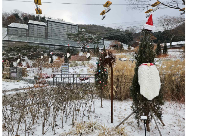
(식물원 속 산타마을에서 소망담기)