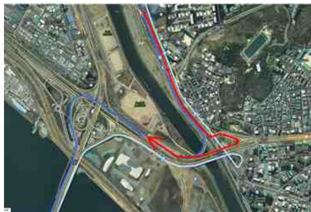
버스[571, 674] 노선 신목동역~안양천 입구 구간