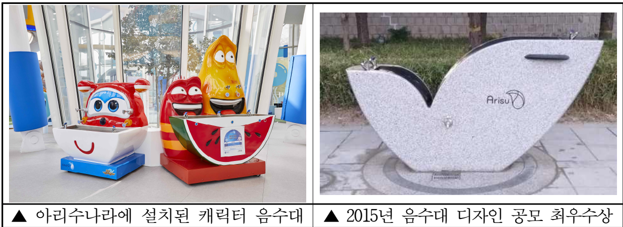
▲ 아리수나라에 설치된 캐릭터 음수대