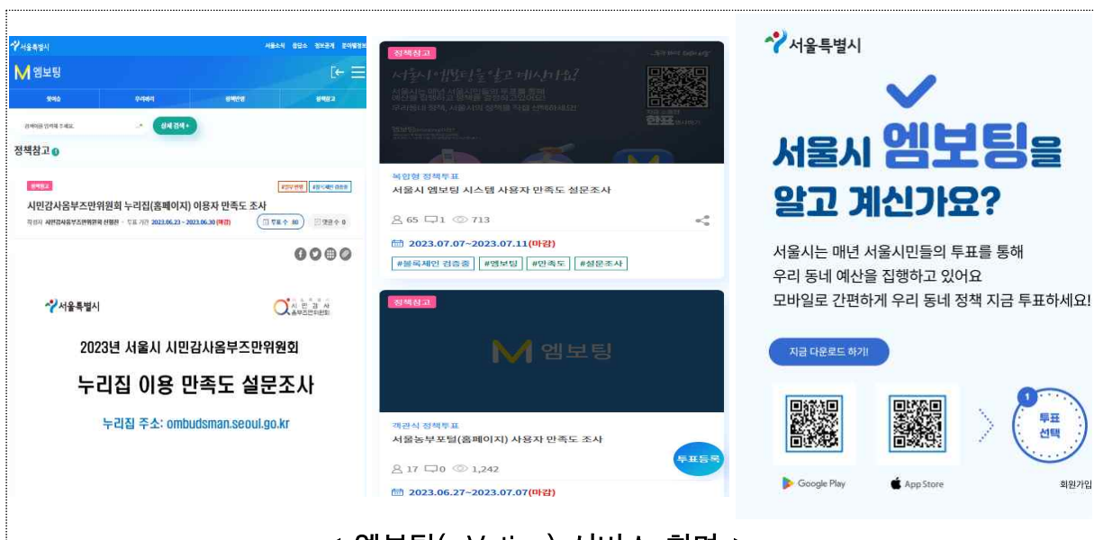
< 엠보팅(mVoting) 서비스 화면 >