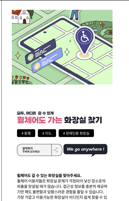
모바일 버전 - 첫 화면