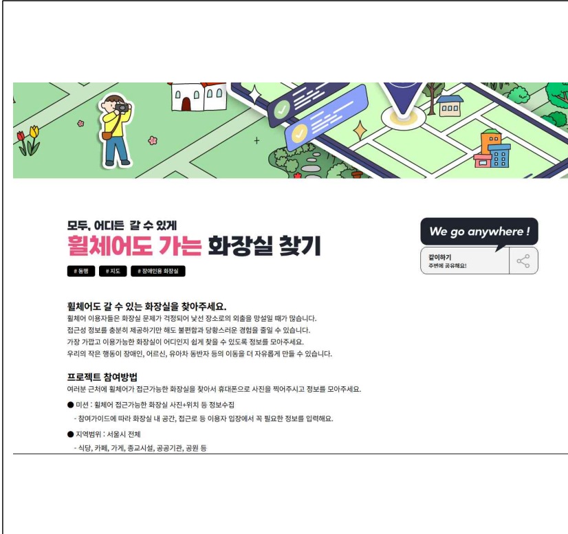
PC버전 - 첫 화면