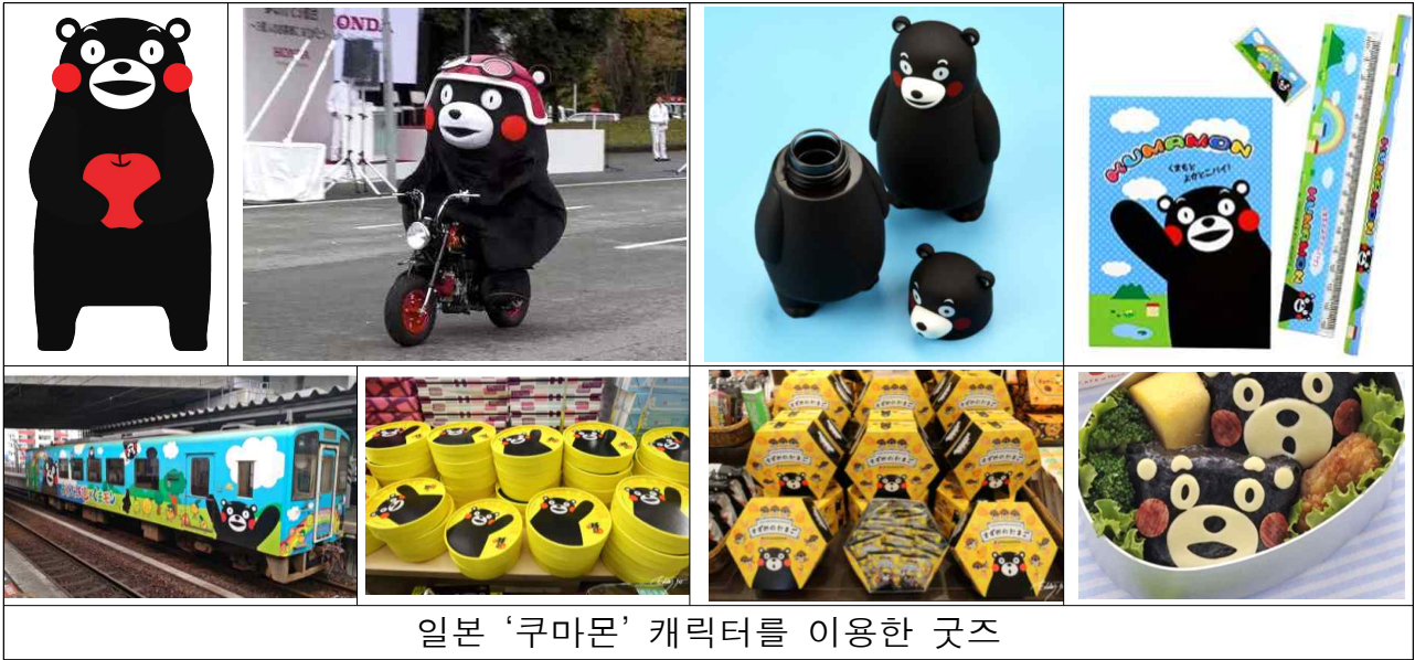
일본 '쿠마몬' 캐릭터를 이용한 굿즈

벤트를 통해 서울 도시브랜드의 인지도를 제고하고 도시마케팅 효과를 강화하고자 신규사업 추진을 위한 예산을 추가 편성하고자 함