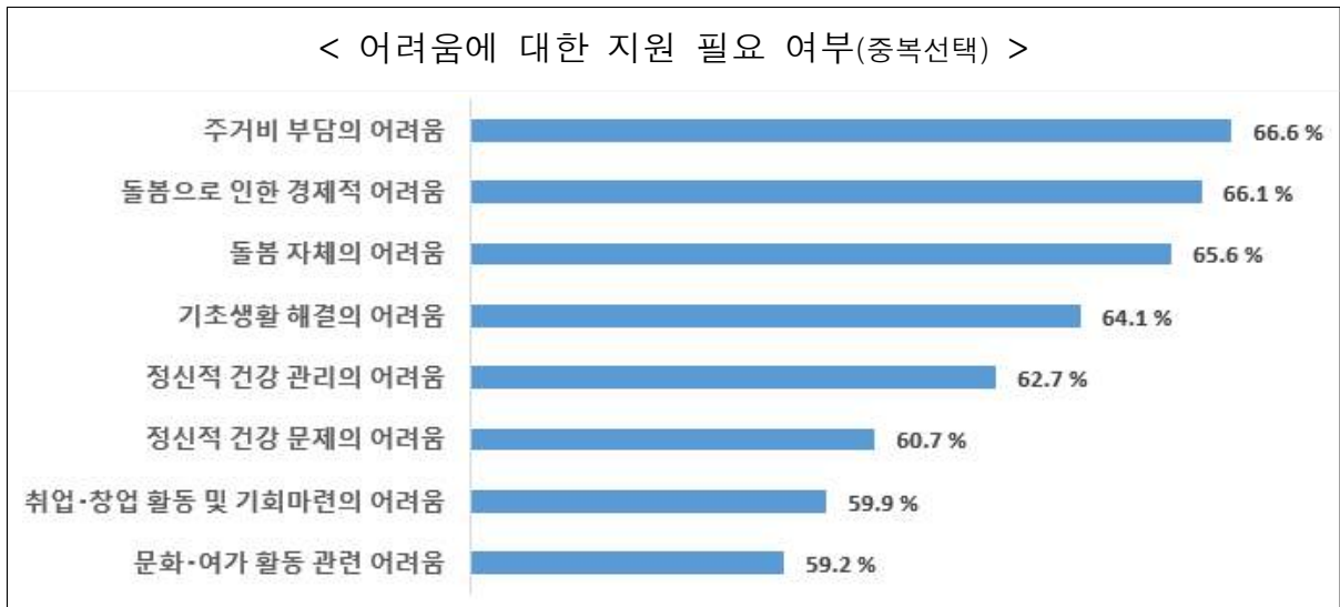
[그림] 가족돌봄청년 외부지원 및 서비스의 필요성