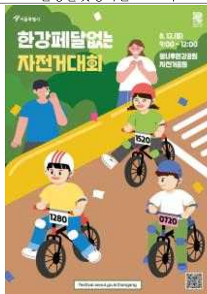
한강페달없는 자전거대회 포스터