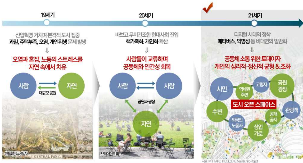
[그림 2] 서울 오픈스페이스의 역할 변화