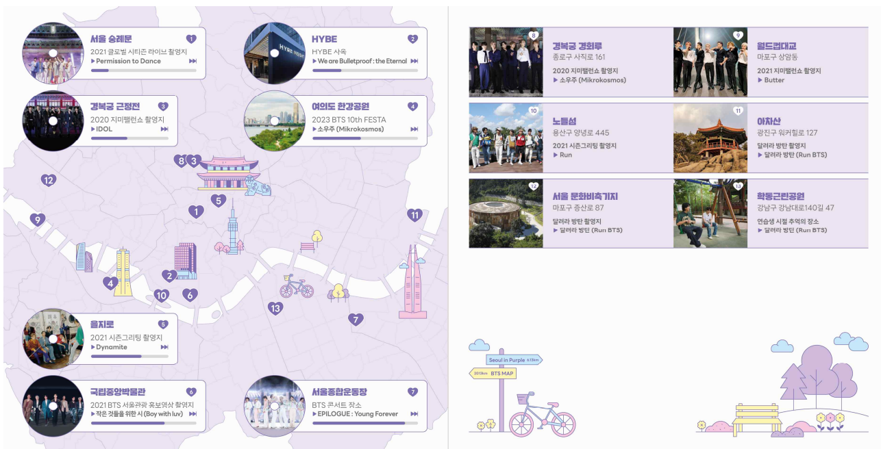
(사진 2) 13개의 방탄소년단 관련 스팟과 장소별 방탄소년단 노래가 선별된 서울방탄투어 지도(내지)