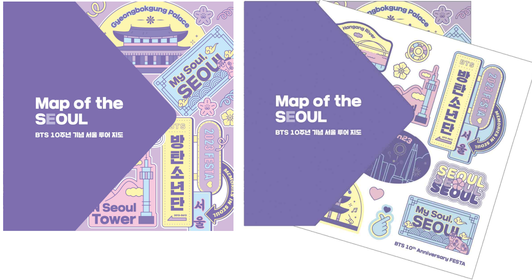
(사진 1) BTS 10주년 기념 서울관광재단에서 제작한 서울방탄투어 지도(Map of the Seoul)와 함께 제공되는 한정 스티커팩