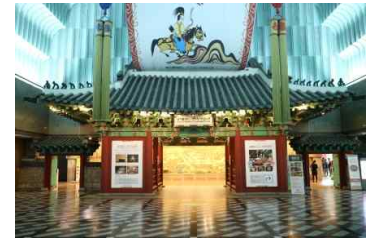
▲ 롯데월드 민속박물관