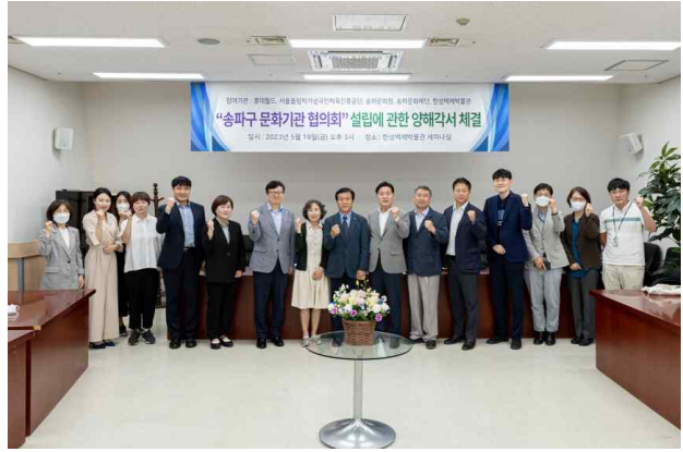
양해각서 체결 모습('23. 5. 19.)