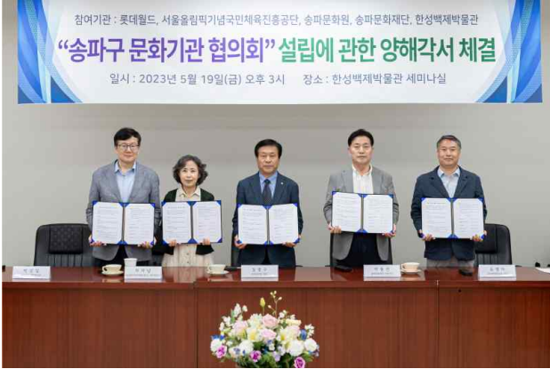
양해각서 체결 모습('23. 5. 19.)