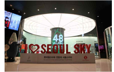
▲ 롯데월드 서울스카이