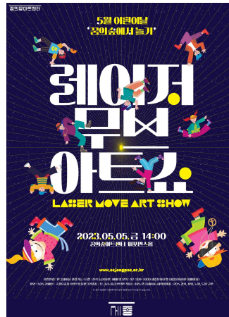
어린이날 꿈의숲에서 놀기 <레이저무브아트쇼>