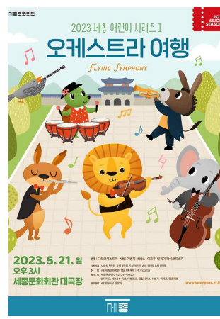
세종 어린이 시리즈 I <오케스트라 여행>