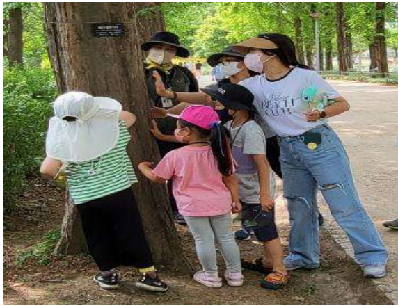
일요 가족 생태나들이