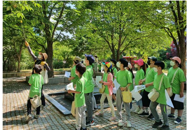
서울숲 어울림 숲길