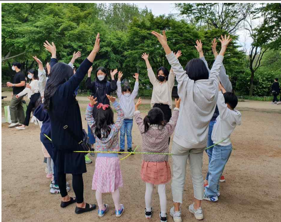
힐링 서울숲 오감체험