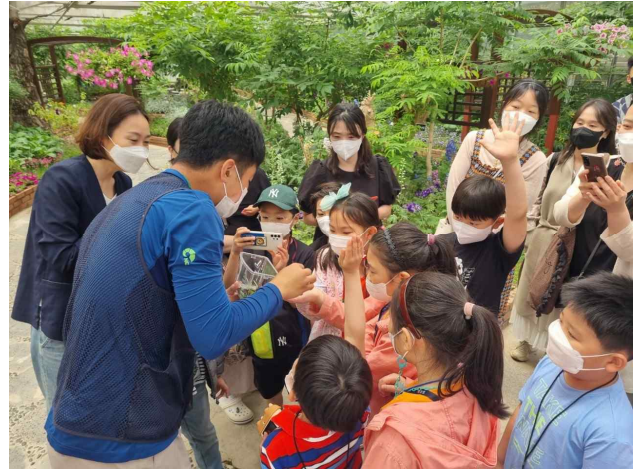
나는 아름다운 나비