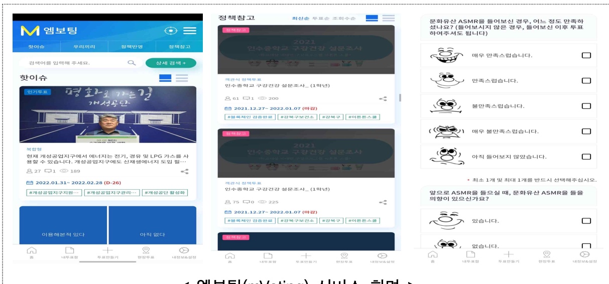
< 엠보팅(mVoting) 서비스 화면 >