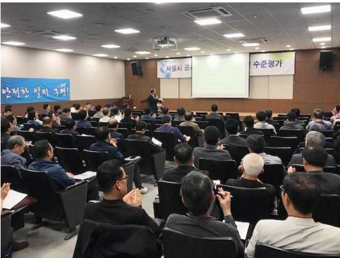
(공사관계자 교육) 2019.10.31.