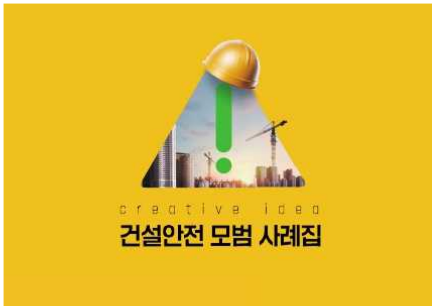
(건설안전 모범 사례집)