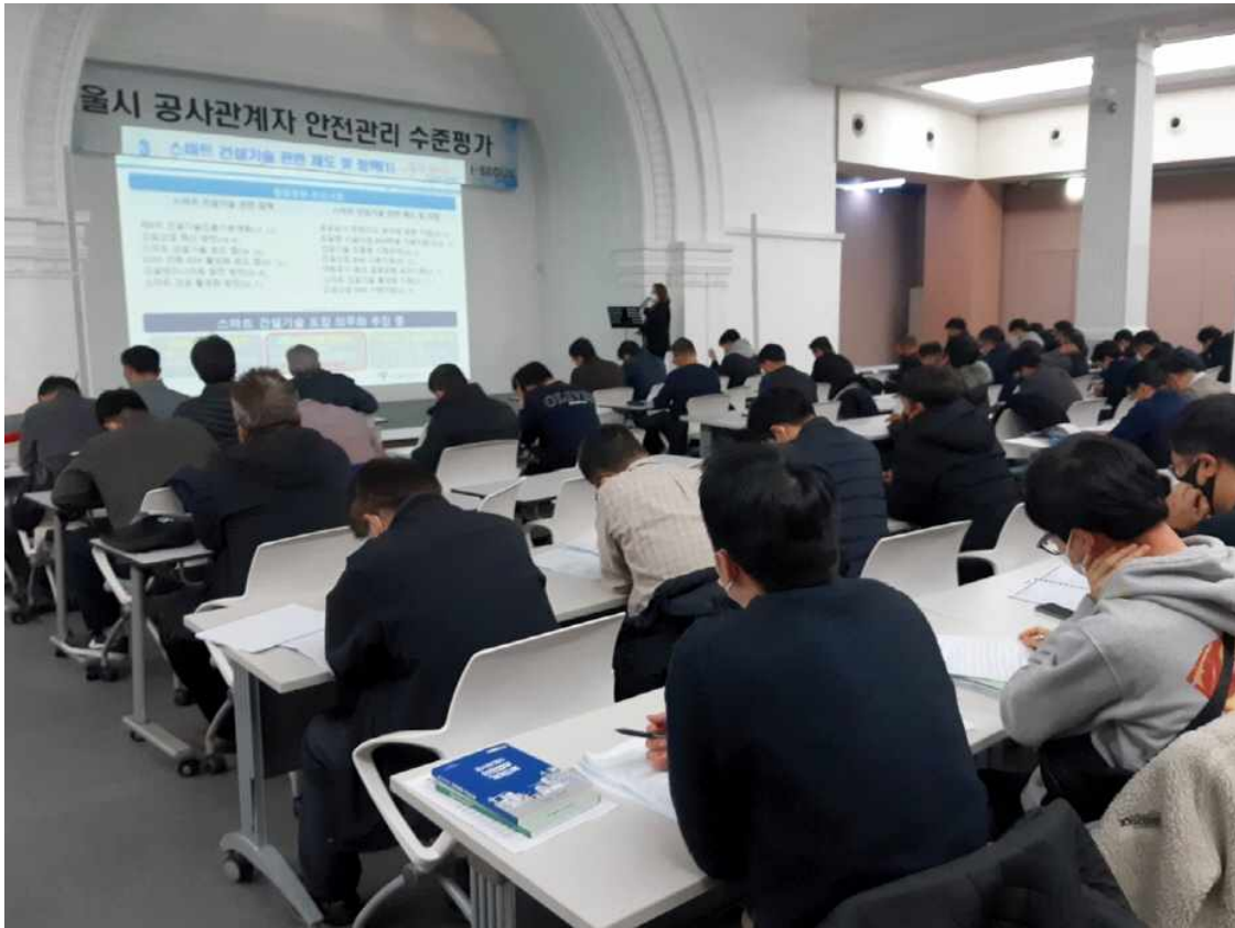
(공사관계자 교육) 2022.12.09.