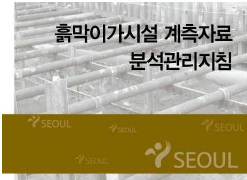
(휴막이시설 계측자료 분석관리지침)