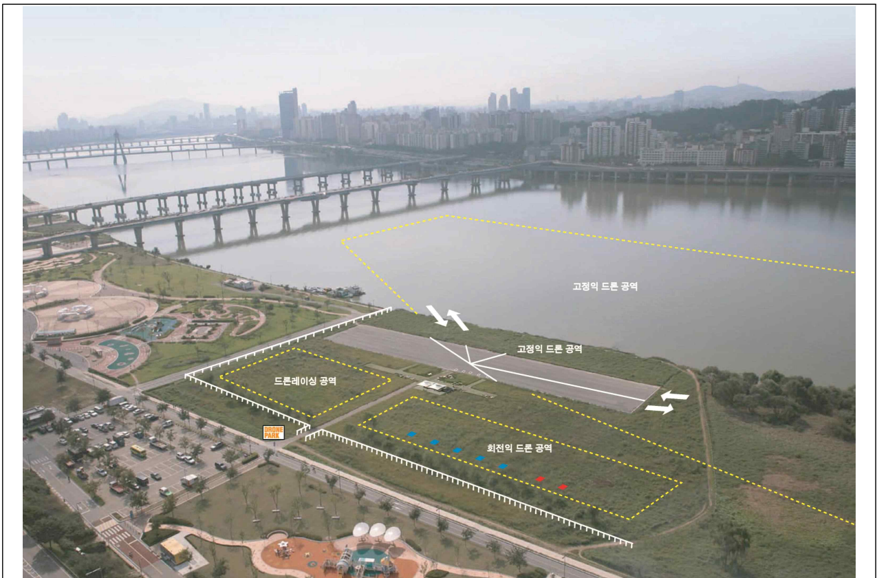
한강 드론장 전경