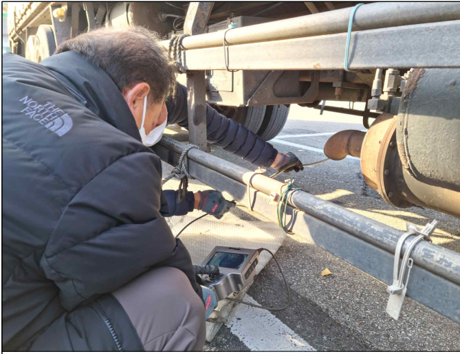
배출가스 상태 점검 확인