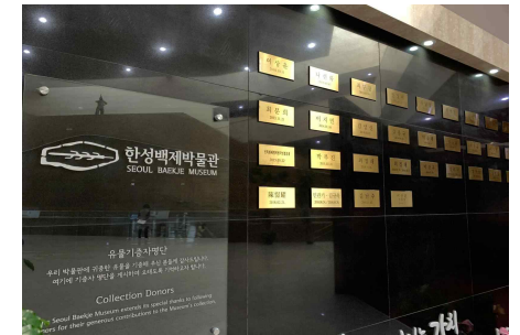
박물관 로비 ‘명예의 전당’ 기증자 명패