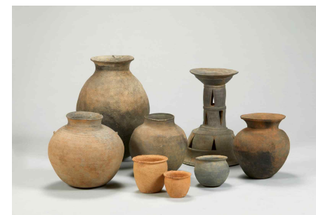
대표 기증자료①: 백제 토기