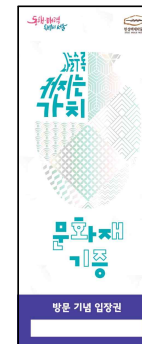
방문 기념 입장권(앞면)