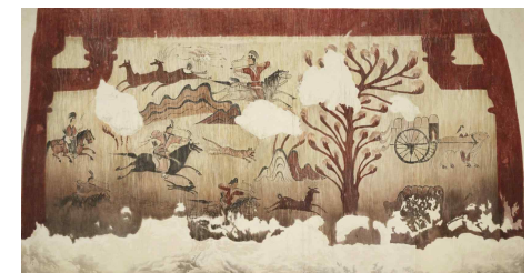
대표 기증자료②: 고구려 고분벽화 모사도