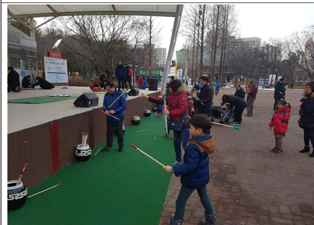
서울어린이대공원에서 투호던지기 체험