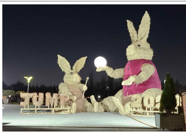
월드컵공원 - '계묘년 토끼 조형물 및 소원존'