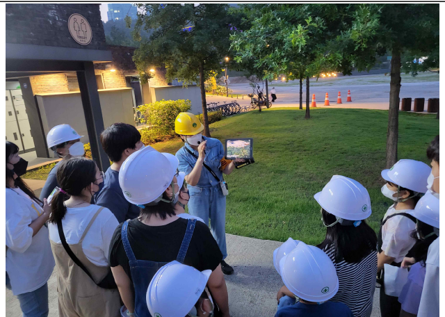
문화비축기지- 해설사와 함께하는 <시민투어>