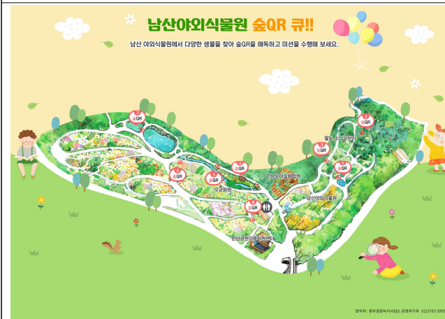
남산야외식물에서 '남산숲 QR 큐!'