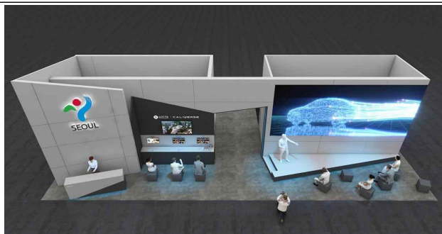
(서울관 전면) 영상시연, 피칭무대 등