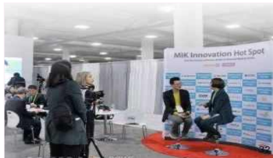
토크쇼 진행사진 예시