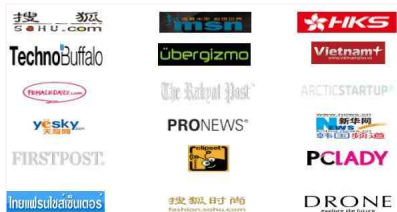
네트워킹 행사 예시