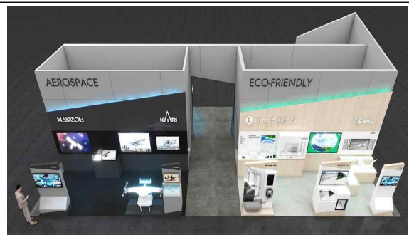
(서울관 후면) 기업별 핵심기술 전시