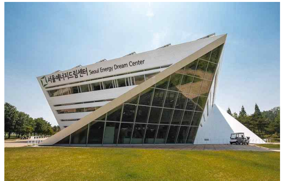
〈 서울에너지드림센터 전경 〉