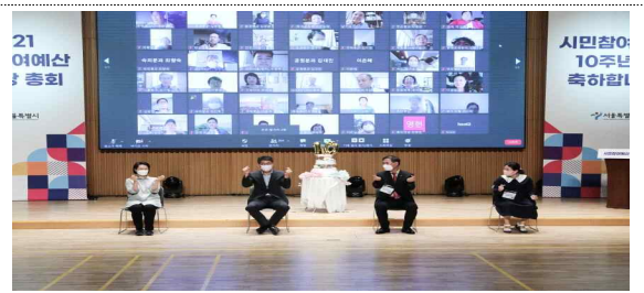
< 2021 시민참여예산 한마당 총회 현장 사진 >