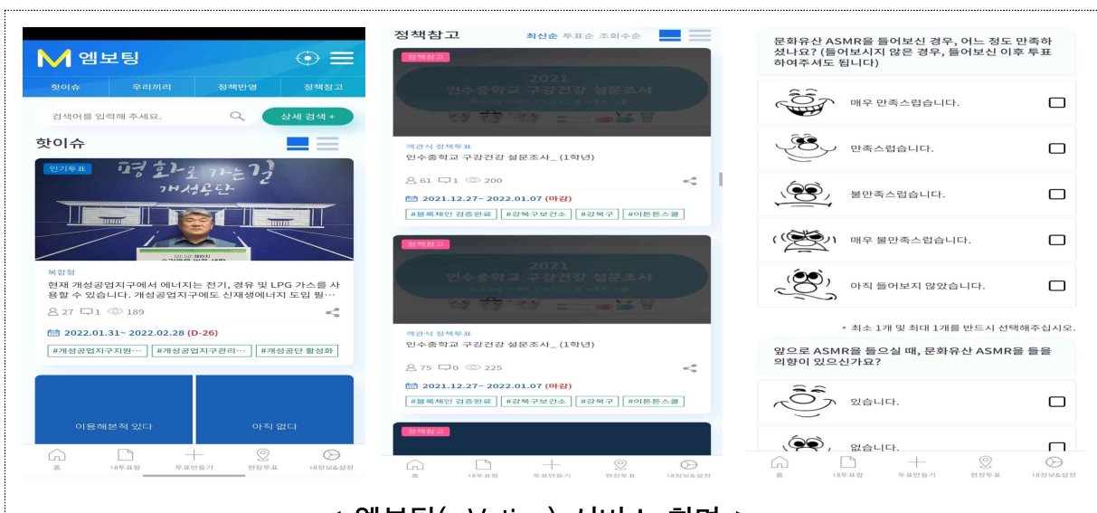
< 엠보팅(mVoting) 서비스 화면 >