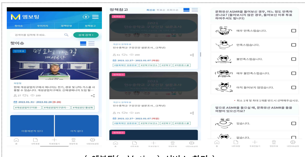
< 엠보팅(mVoting) 서비스 화면 >