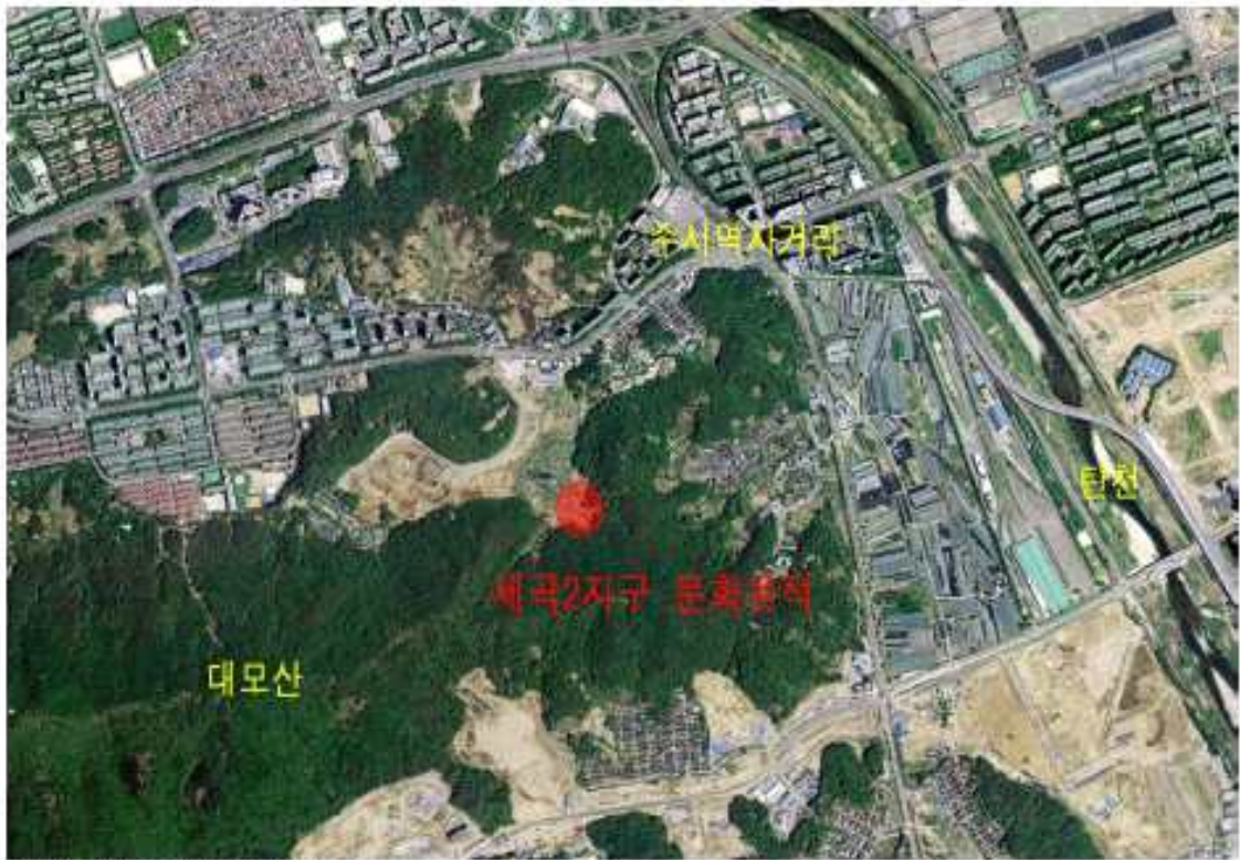
조사지역 위성사진 위치도