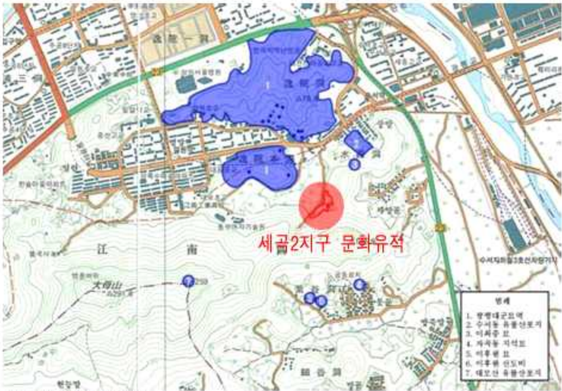
조사지역 주변유적 분포도