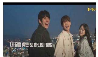
<재단 홍보 영상>