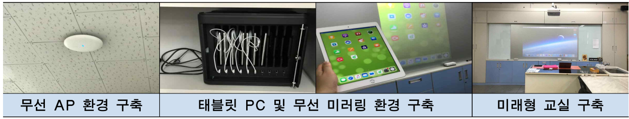
무선 AP 환경 구축 태블릿 PC 및 무선 미러링 환경 구축 미래형 교실 구축