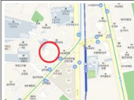
〈위 치 도〉 남영역 도보 6분