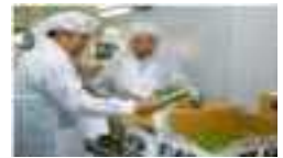
【 학교검수검품 】