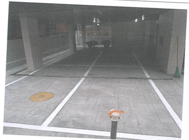
02-1 주차장 전경