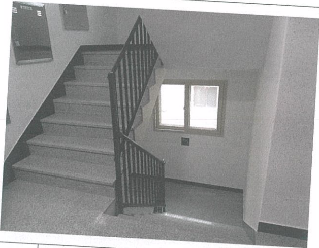
04 계단실 전경