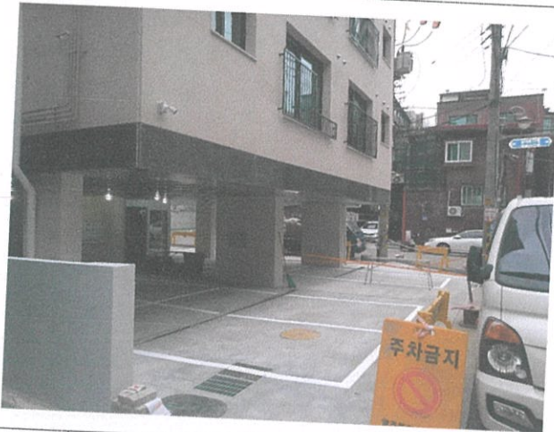
02 주차장 전경