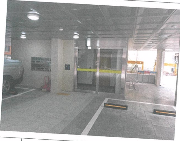
03 동출입구 현관 전경(외부, 내부)