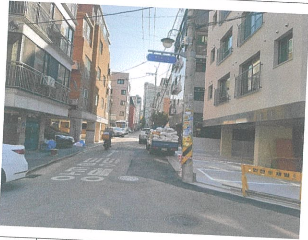
01 건물 외부 전경