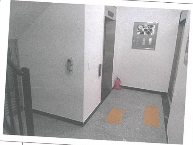
03-1 동출입구 현관 전경(외부, 내부)