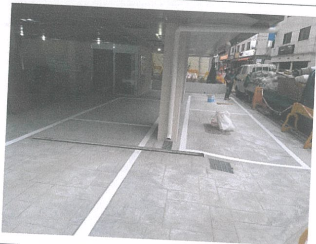
02-2 주차장 전경