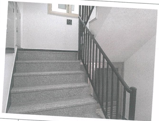
04-1 계단실 전경