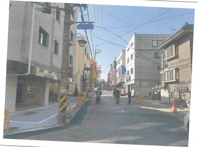
01-1 건물 외부 전경