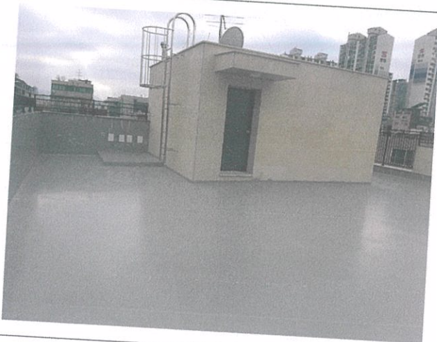
05 옥상 전경