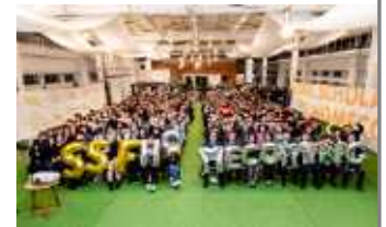
<서울장학재단 10주년 행사>