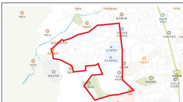
인수동 535번지 일대