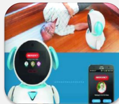
1인가구 고령자 돌봄로봇