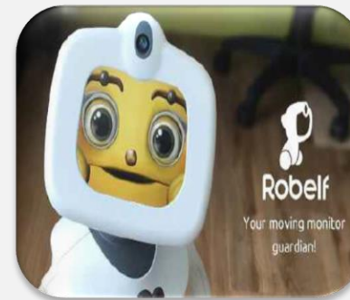
학생들과 함께, 공부와 숙제 등 교육지원