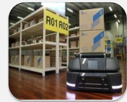
대규모 물류창고 관리 및 택배배송