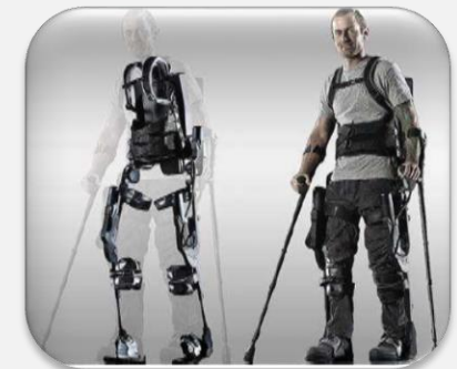
장애인 근력강화 보행보조 로봇