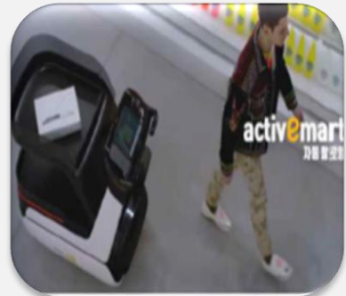
간편결제 자율주행 쇼핑카트