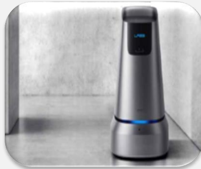
안내 도움 로봇