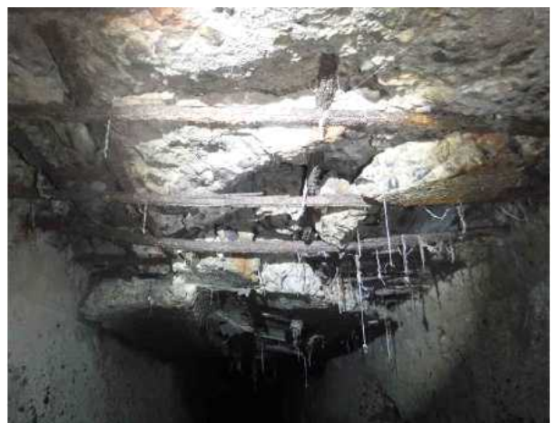
[그림 1] 노후 사각형거 현황 사진