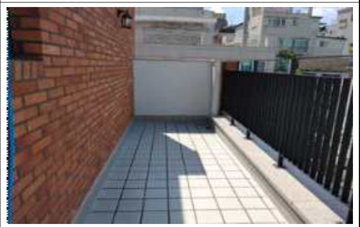
사진2(세대 외부 테라스)