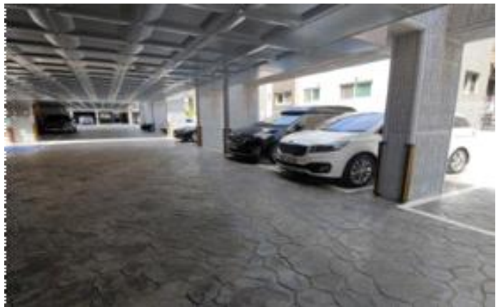
사진1(동출입구 현관외부 전경)