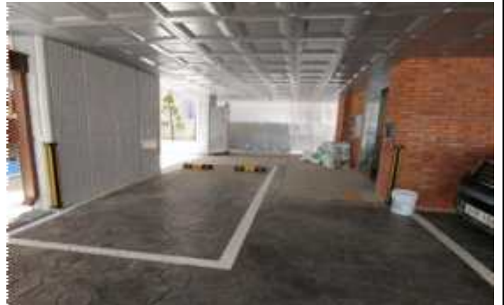
사진2(동출입구 현관내부 전경)