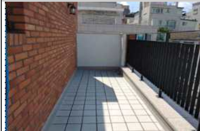
사진1(세대 외부 테라스)