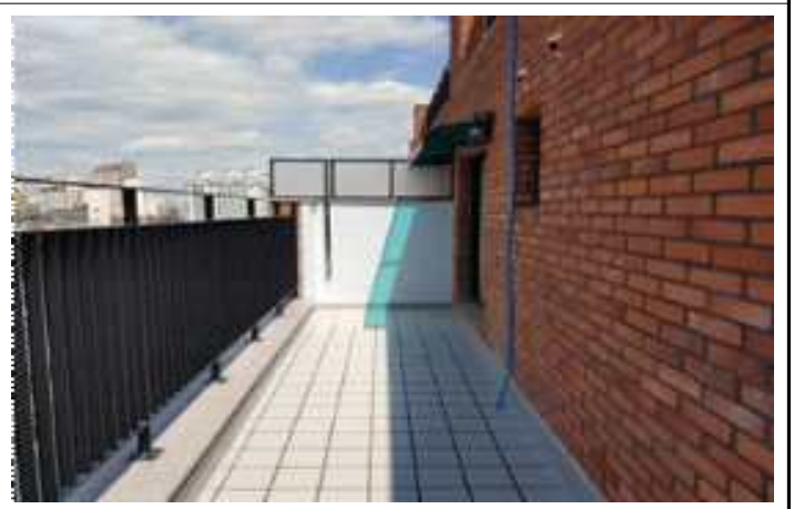
사진2(세대 외부 테라스)