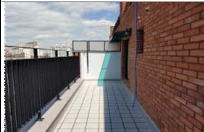
사진1(세대 외부 테라스)