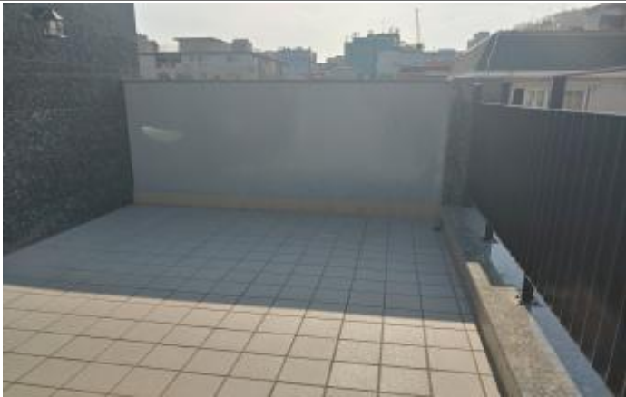
사진1(세대 외부 테라스)